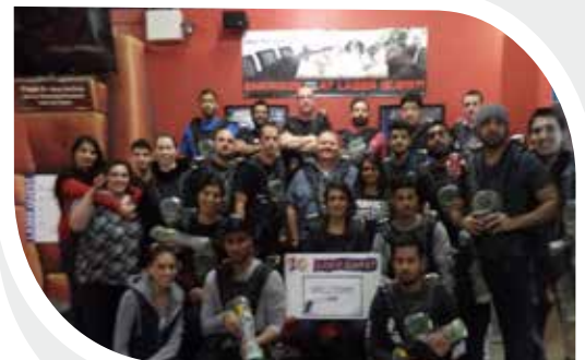
L'équipe de G4S Mississauga à Laserquest